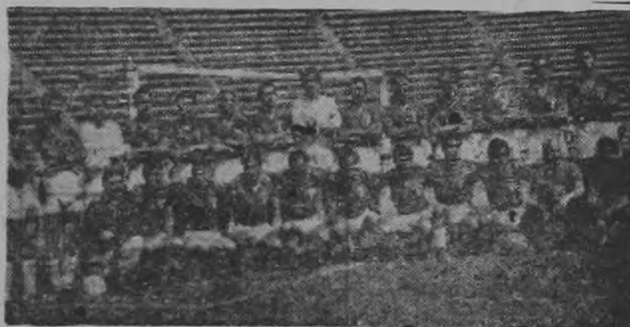
SELECCION DE MEXICO: Dura prueba le espera frente a la Selección Chilena.