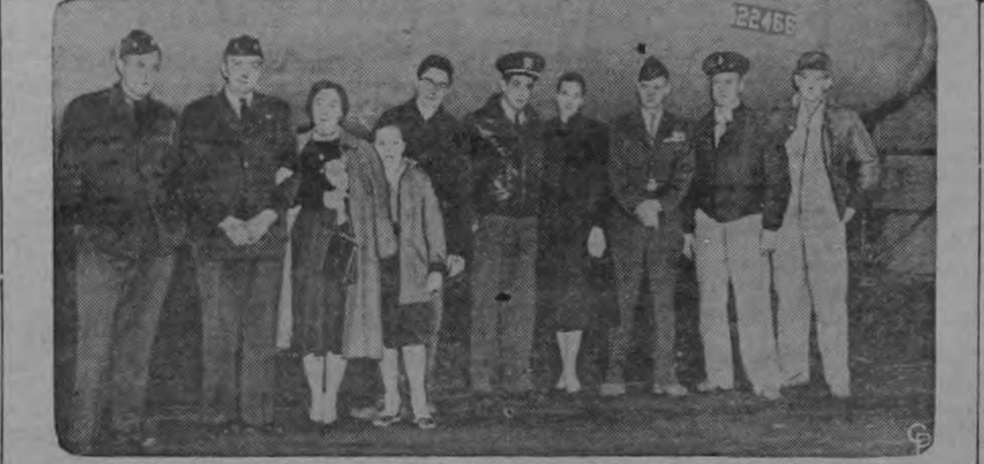
El avión patrulla de bombardeo naval que se esrelló en Venezuela en vuelo a la Antártica en una misión de auxilio, se ve en la foto antes de salir de la estación naval de Patuxent, en Maryland. La tripulación y los miembros de sus familias que fueron a despedirlos aparecen en la foto. El avión cayó en un claro de monte y todos sus ocupantes que resultaron ilesos fueron llevados en helicópteros a Trinidad.