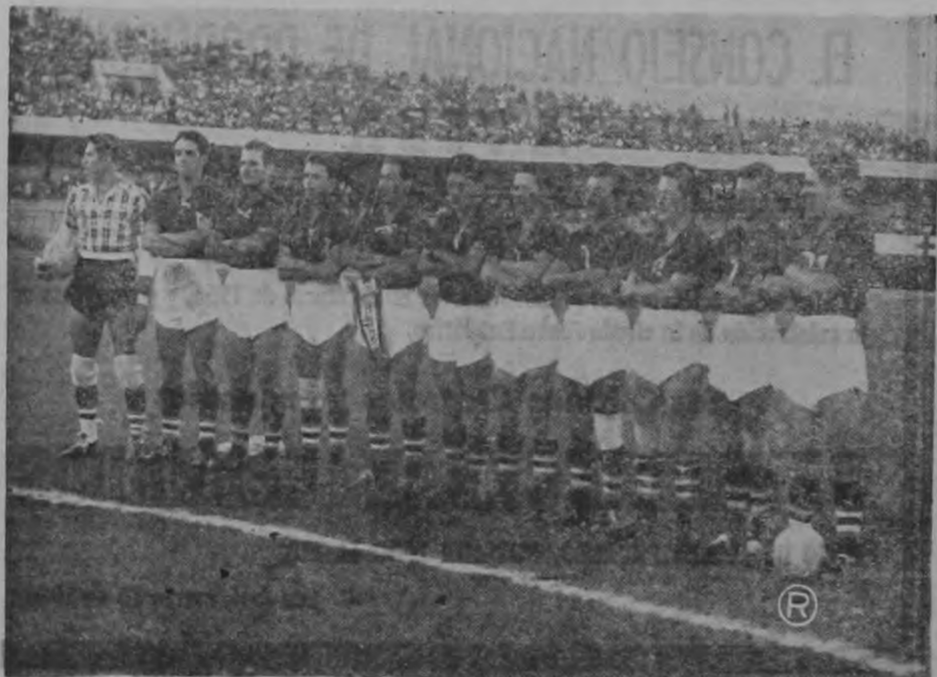
SELECCION NACIONAL DE COSTA RICA. — La afición nacional espera confiada en el rendimiento de nuestra selección en el encuentro de hoy contra Perú.

El encuentro estelar lo jugaron los equipos de Grecia y Naranjo. Tomando en cuenta las características de juego se suponía que este partido resultaría interesante, como en efecto lo fué. En la etapa inicial los conjuntos jugaron a todo vapor. La pelota fué llevada insistentemente de un marco a otro. En la complementaria los griegos, aprovechando el cansancio de sus rivales lograron batir dos veces la portería de Naranjo para que finalizara el partido con el marcador de dos goles por uno a favor de la escuadra griega.