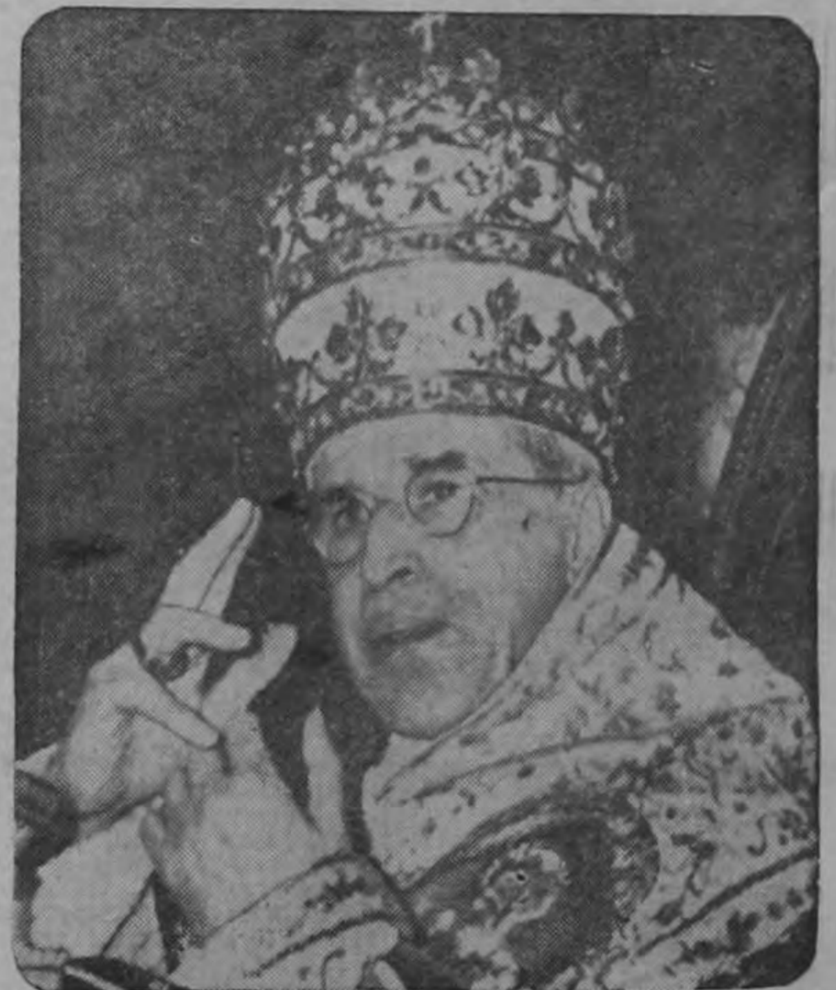
El Papa Pío XII alza su mano para bendecir a los fieles que se hallaban al trono situado debajo del alta de la Basílica de San Pedro en Roma donde servicios especiales conmemoraron el 17 aniversario de la coronación del Pontífice. Aparece con la tiara papal que se puso en la cabeza el 12 de Marzo de 1939. Treinta mil personas llenaron la Catedral para la misa especial, mientras otras 100,000 desafiaron la lluvia para recibir la bendición que él impartió desde la ventana de su estudio.