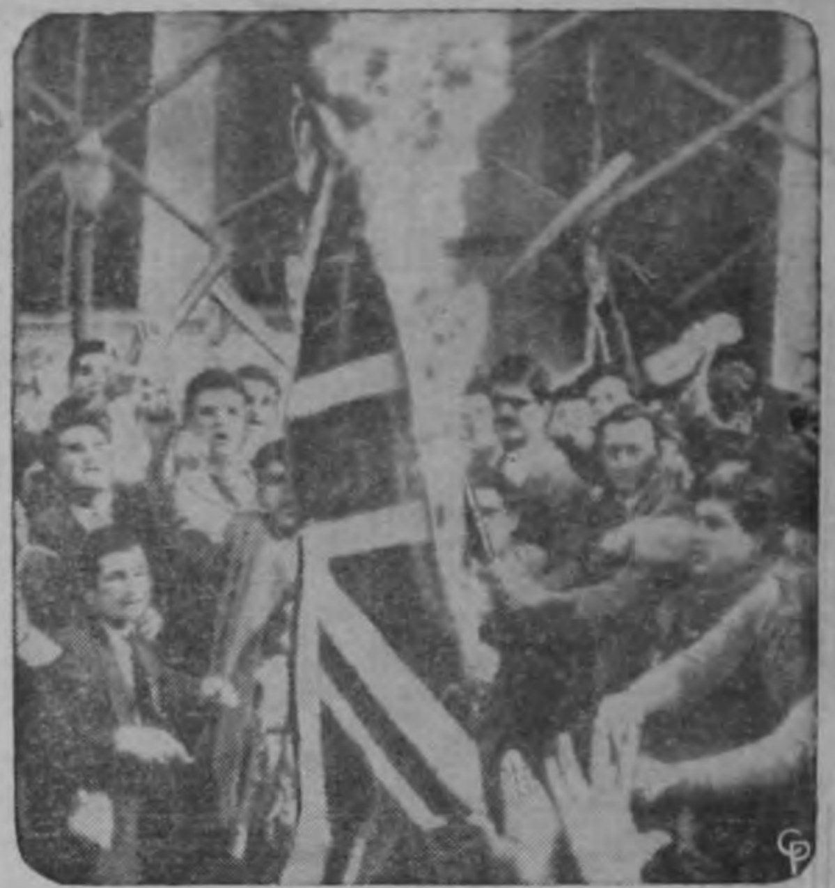
Protestando del destierro del Arzobispo Makarios de Chipre, los estudiantes en la Universidad de Atenas queman la bandera británica. Millares de griegos enfurecidos organizaron manifestaciones anti-británicas y una huelga general paralizó la isla de Chipre. Veintenas de personas resultaron lesionadas en choques callejeros. El Arzobispo Makarios, educado en Boston, arrastrado por dirigir la agitación chipriota para la unión con Grecia, es llevado a bordo de una fragata británica hacia las islas Seychelles.