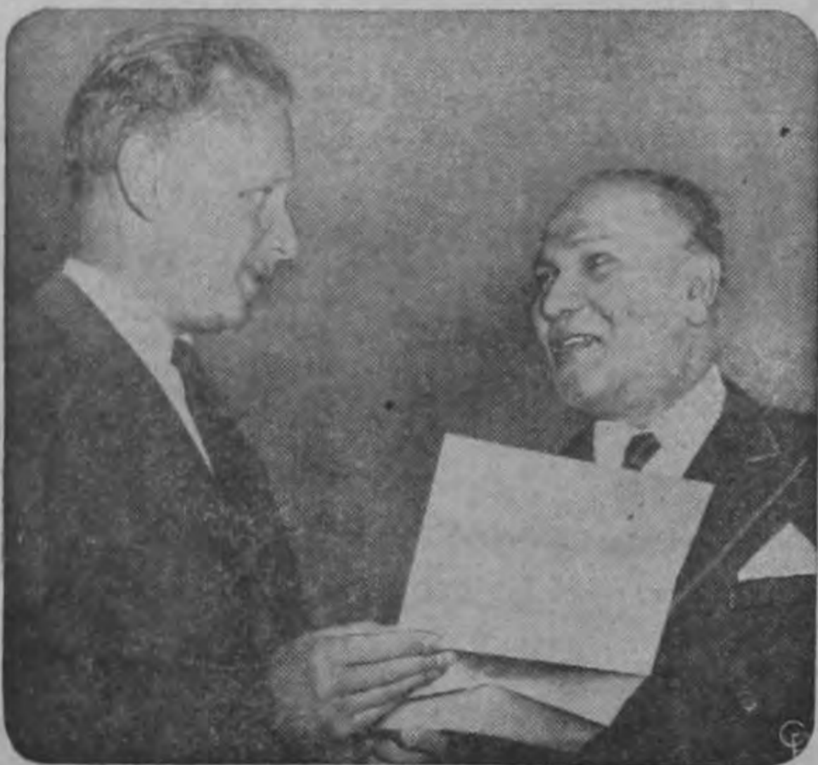
El Secretario General de las Naciones Unidas Dag Hammarskjöld (izquierda) acepta las credenciales de Sir Senarat Gunewardene, como representante permanente de Ceylán en las Naciones Unidas en Nueva York. Ceylán es la primera de las 16 naciones. Sir Senarat también es el Embajador de Ceylán en Estados Unidos.