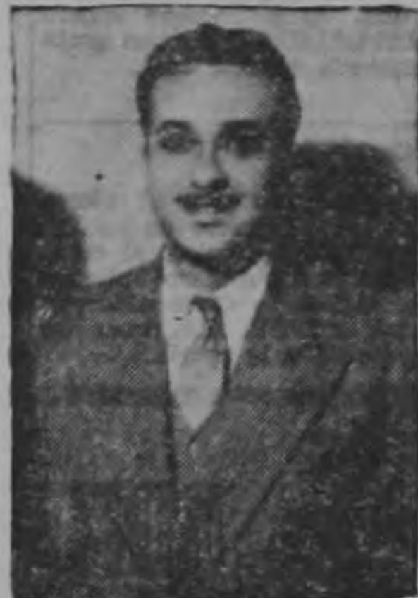
Lic. don Alberto F. Cañas E.

El cocktail de cumpleaños de ayer en honor del Sr. Vice Ministro de Relaciones Exteriores