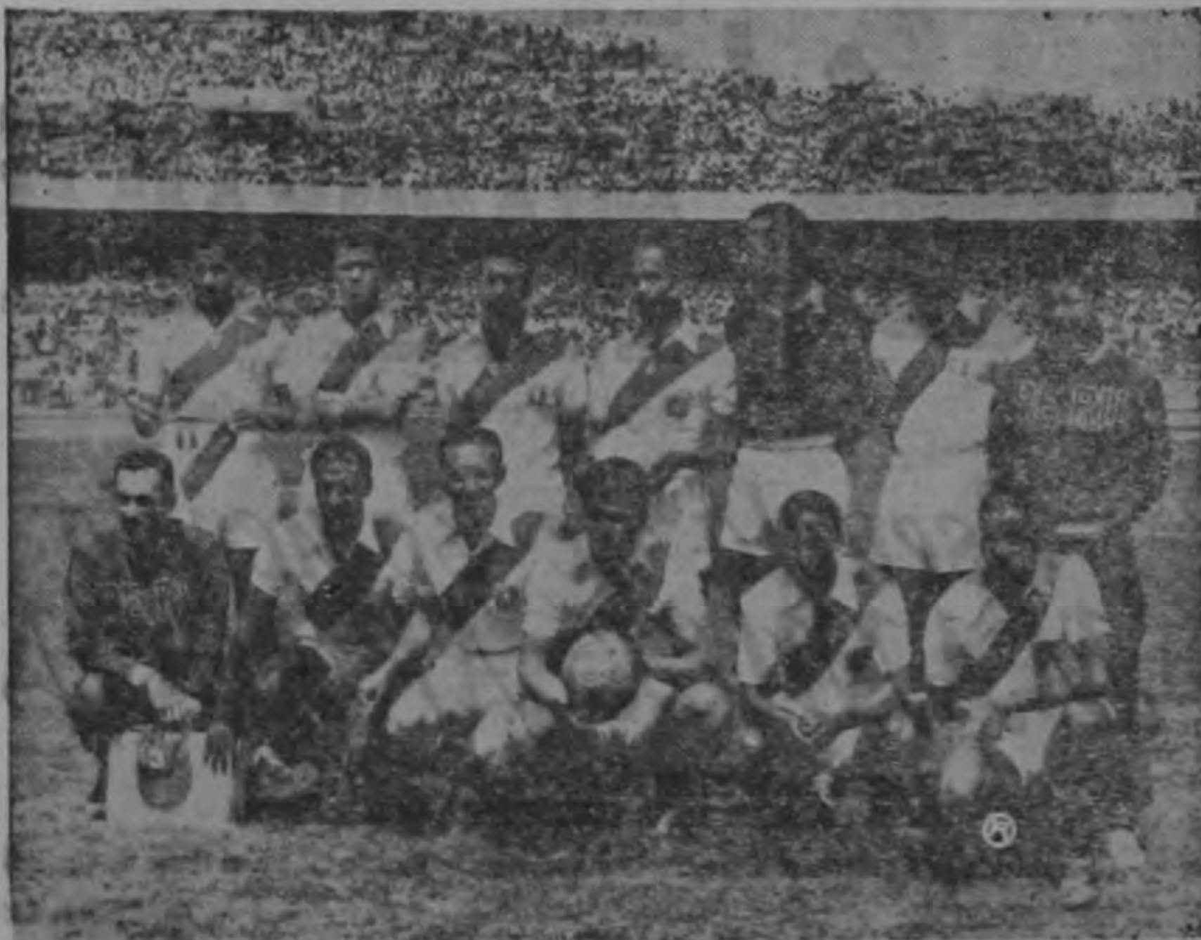
SELECCION DE PERU. — Hoy será nuestro adversario en el encuentro preliminar del Panamericano que se juega en México.