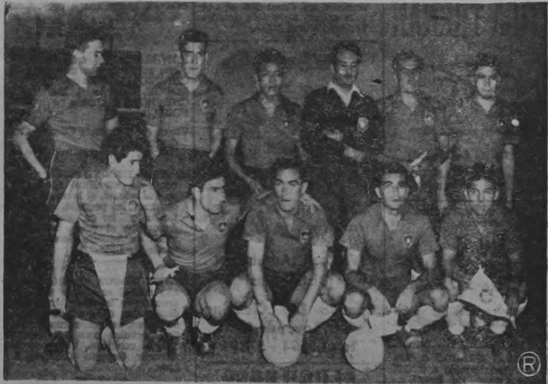
SELECCION DE CHILE. — En el partido frente a los peruanos demostraron que cuando se quiere se puede presentar batalla. — Los chilenos esperan derrotar a la escuadra mexicana hoy.

Los banqueros se han venido preparando a conciencia para poder dar un buen rendimiento en la confrontación que sostendrán con los hermanos futbolistas del norte. En fechas anteriores hemos tenido la oportunidad de ver en acción a los muchachos del banco y a decir verdad integran un poderoso trabuco. Al consignar la noticia de la partida de los futbolistas del Banco para la República de Nicaragua les deseamos mucho éxito en su compromiso.