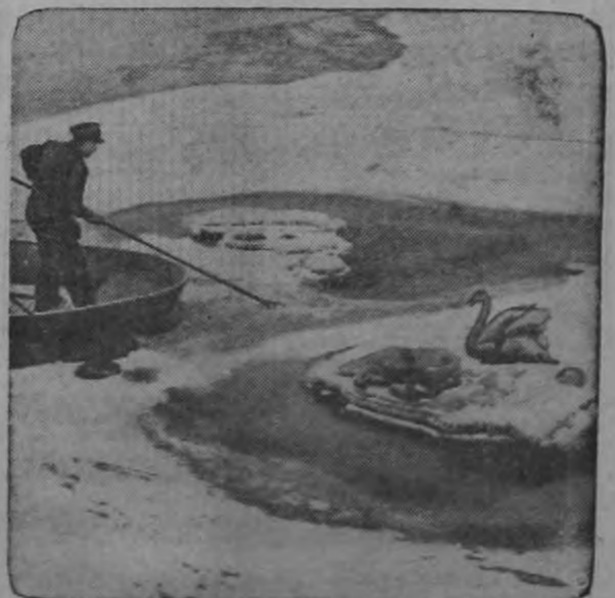
Congelado en los hielos próximos a Estocolmo, un cisne es rescatado por un hombre en un bote, que usa una larga pértiga para llegar al ave indefensa. La severa ola de frío en Europa ha producido grandes molestias a las aves marítimas en aguas de Suecia, además de interrumpir, y desorganizar la navegación.—(INP).