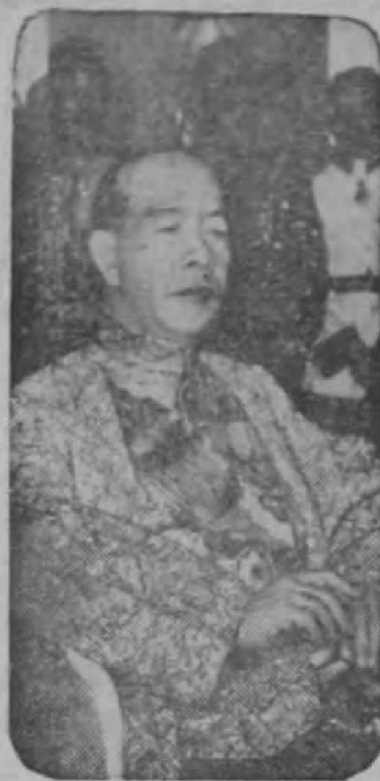
El Rey Suramarit de Camboya luce el uniforme de jefe del ejército durante las ceremonias de coronación en su palacio de Phnom-Penh. Los miembros del cuerpo diplomático asistieron y hubo un desfile de 8,000 soldados.