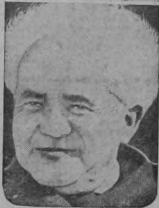
El Premier Gamal Abdel Nasser (arriba) de Egipto y el Premier de Israel David Ben-Gurion (abajo) aparecen en estas fotos recientes tomadas al ser entrevistados para un próximo programa de televisión de la CBS.