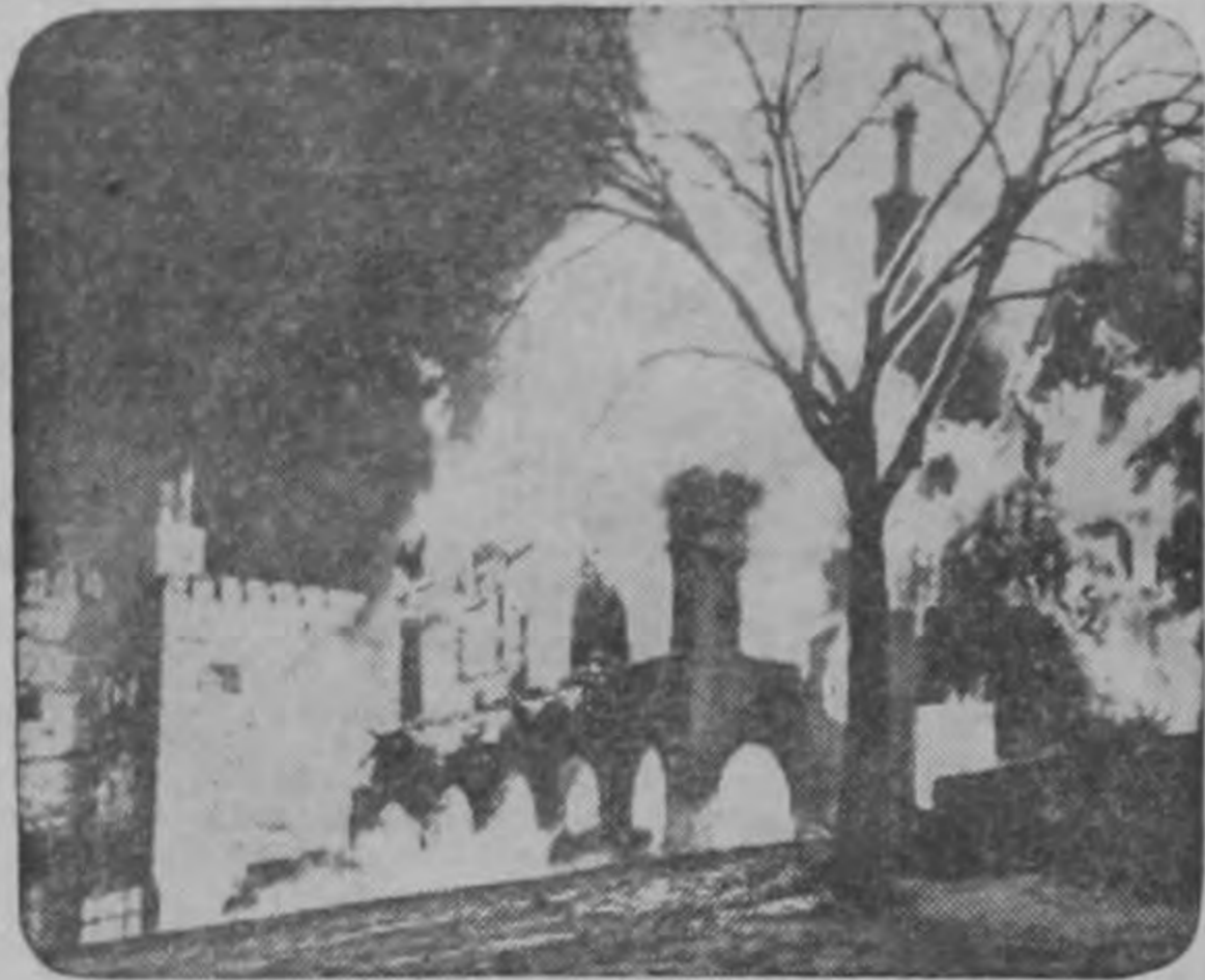
Las llamas consumen el Seminario Jesuita del Shadowbrook, en Lenox Massachusetts, donde cuatro clérigos católicos perecieron quemados. Unos 127 más bien saltaron para salvarse o se deslizaron con cuerdas para huir del edificio incendiado. El fuego se cree que comenzó a causa de una explosión en un cuarto de calderas.