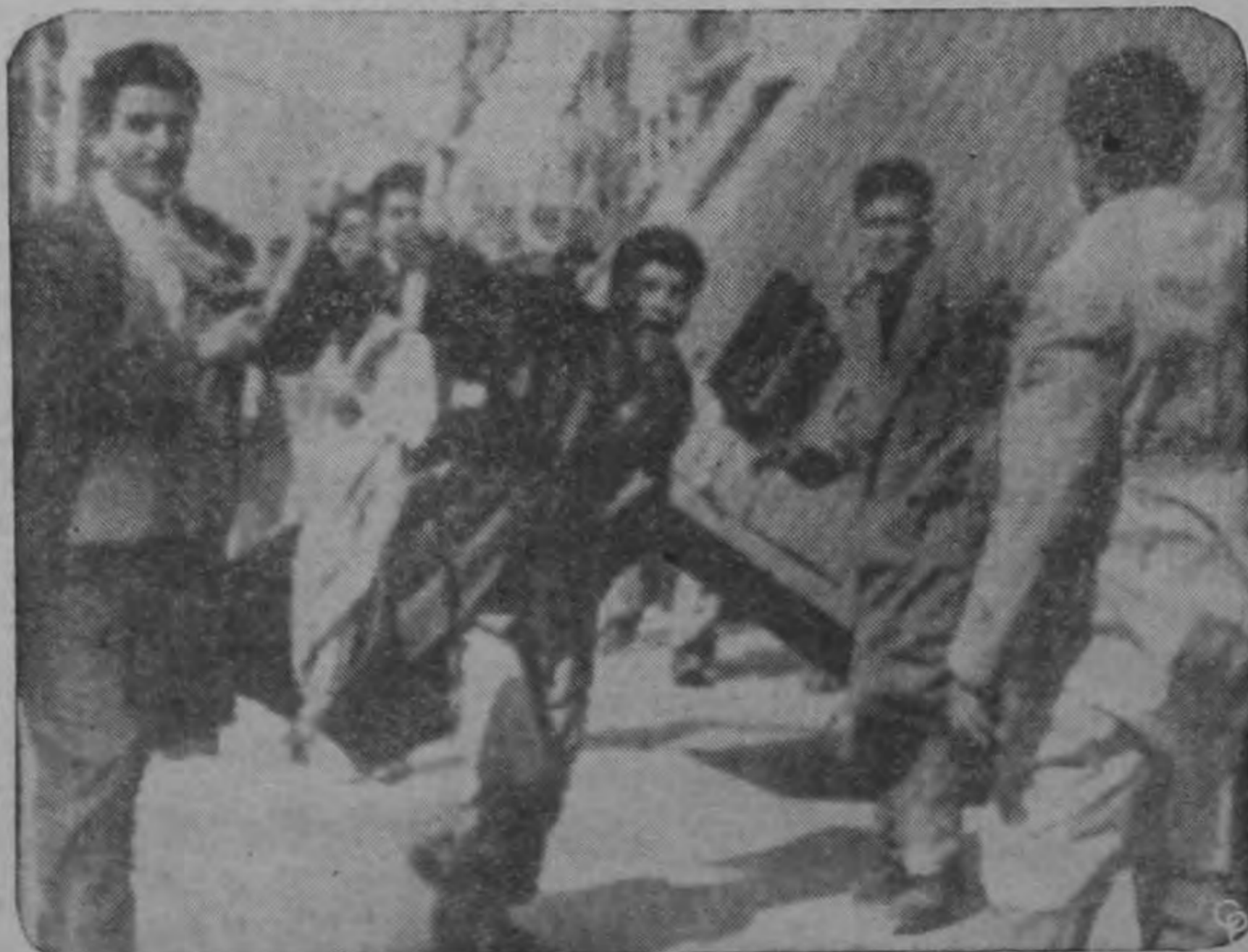
Una enorme refrigeradora colocada como barricada contra los amotinados en Salónica, es volcada por los estudiantes al romper la barrera durante las manifestaciones anti-británicas por el exilio del Arzobispo Makarios de la isla de Chipre. El Arzobispo ha sido el líder de los chipriotas que buscan la unión con Grecia. Una huelga general ha paralizado a Chipre y muchas ciudades griegas han tenido manifestaciones de protesta.