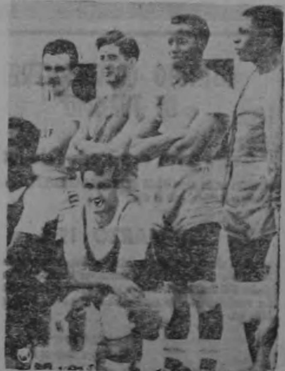
Equipo de la fuerza pública que ganó el cuadrangular de básquet celebrado el domingo entre los equipos Sembrero, Libertad, Heredia y Fuerza Pública.