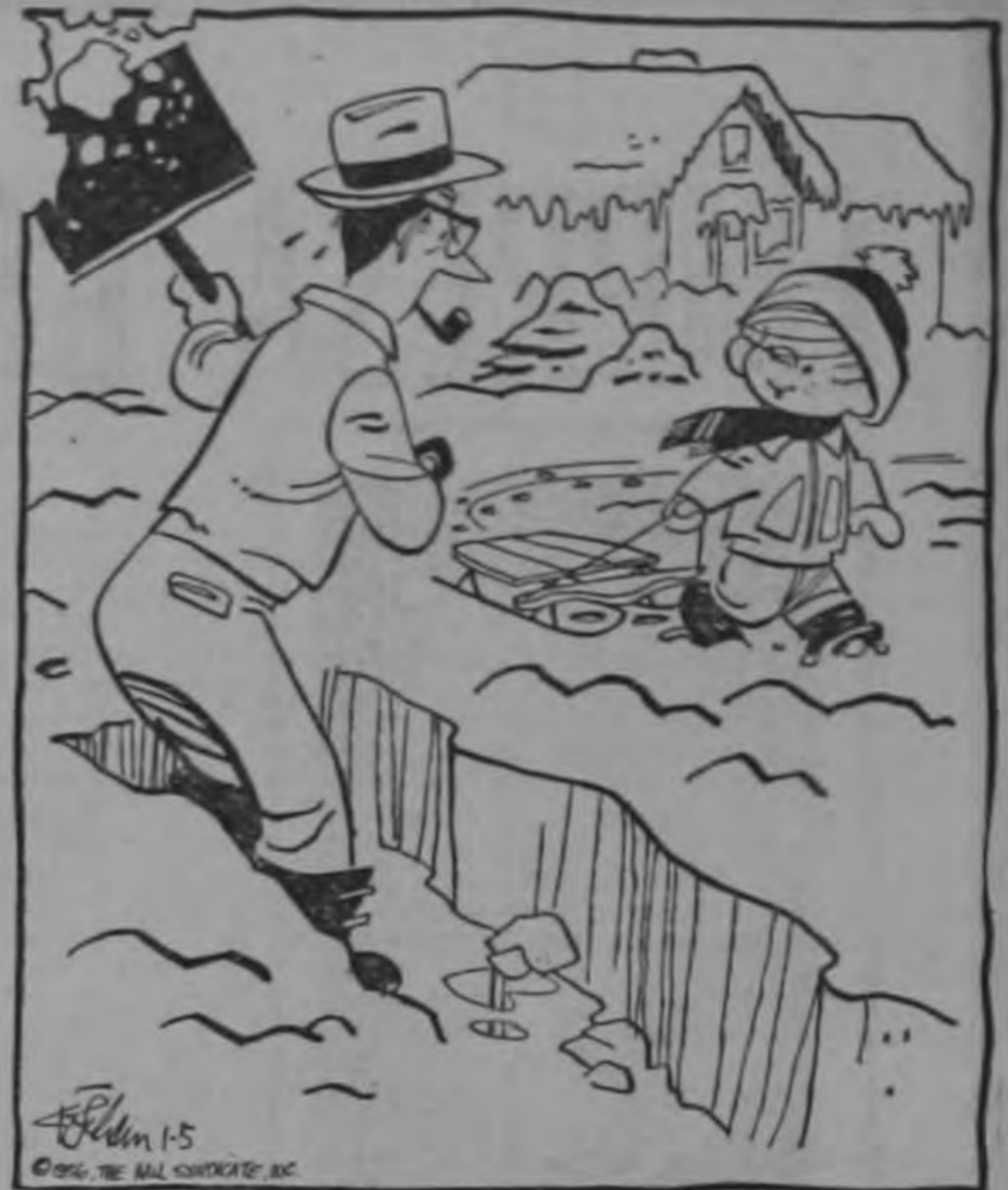
—Papi, ¿mira que a ti te gusta la nieve, eh?